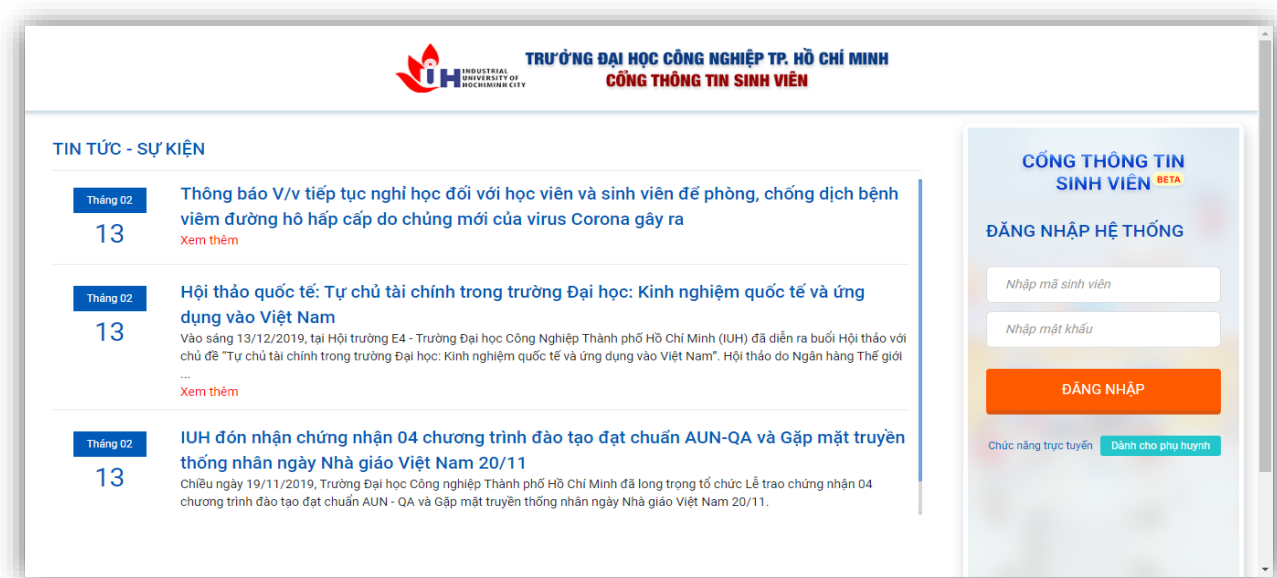
Hình 1: Đăng nhập