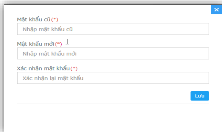
Hình 2: Thay đổi mật khẩu